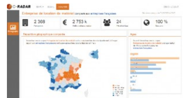
Exemple de firmographie sur une entreprise de location de matériel en comparaison avec les entreprises françaises du même secteur d'activité

Née il y a trois ans, Data Publica s'est fait connaître en mettant en place un catalogue de toutes les données disponibles en open data. Depuis, l'entreprise a fait son chemin et a trouvé un moyen original de valoriser les données. ... Lire la suite.