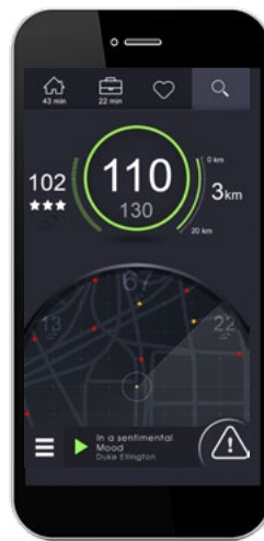
Le mode ville ou mode « sonar » permet de visualiser les alertes autour de soi, la limitation de vitesse et les informations « éclaireurs »

Enregistrer ses adresses favorites ou ajouter un avatar à son compte personnel est désormais possible. Grâce aux identifiants, les utilisateurs peuvent se connecter depuis n'importe quel smartphone pour accéder à leur application ainsi qu'à leurs paramètres personnels.