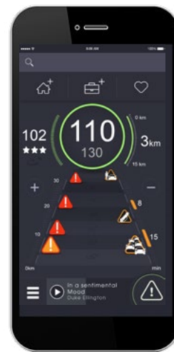
Le mode forecast permet d'anticiper les aléas de la route sur votre itinéraire